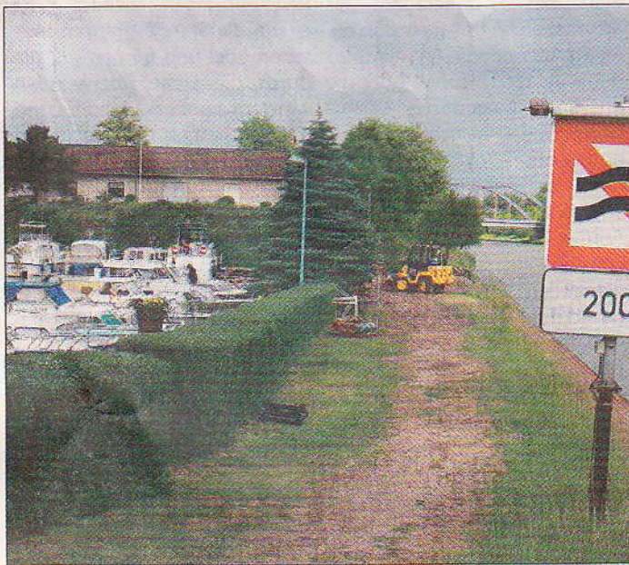
Der clubeigene Yachthafen der Braunschweiger Freizeitskipper. Die Kosten für das Ausbaggern sollen laut Ratsvorlage zum Teil die Steuerzahler tragen.

Ein Fünftel der jährlichen Fördersumme für Sportvereine wird im Club-Hafen verbaggert