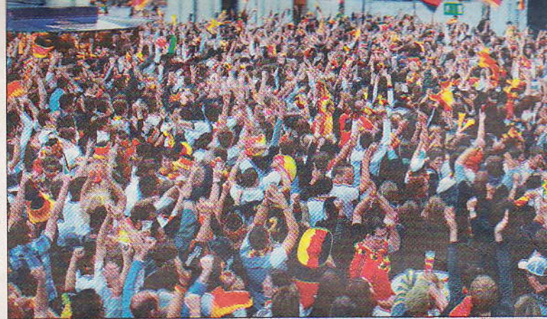
Der Moment des kollektiven Glücks: Soeben hat Podolski das 1:0

Ganz Braunschweig versinkt wieder im schwarz-rot-goldenen Jubel. Die jungen deutschen Himmelsstürmer erfüllen am Kap den sehlichsten Wunsch ihrer Fans und zerlegten mit taktisch variablem Spiel ein unterklassiges Team aus Australien nach Belieben. Nicht einmal die sensationelle Höhe des Sieges kann bemäkelt werden. Wann ist jemals eine Mannschaft in ihrem ersten Gruppenspiel mit vier Toren ohne Gegentreffer gestartet? Fortsetzung auf Seite 3